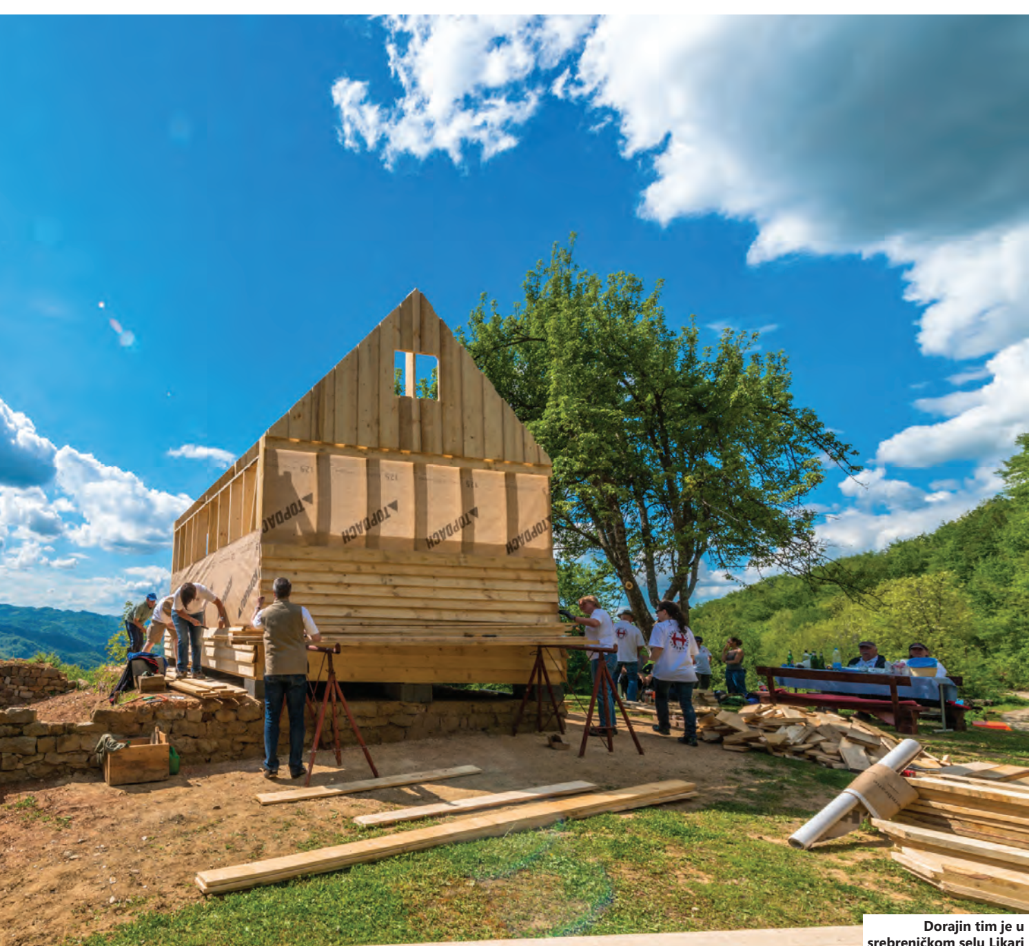
Dorajin tim je u srebreničkom selu Likari pomogao u pravljenju montažnih kuća