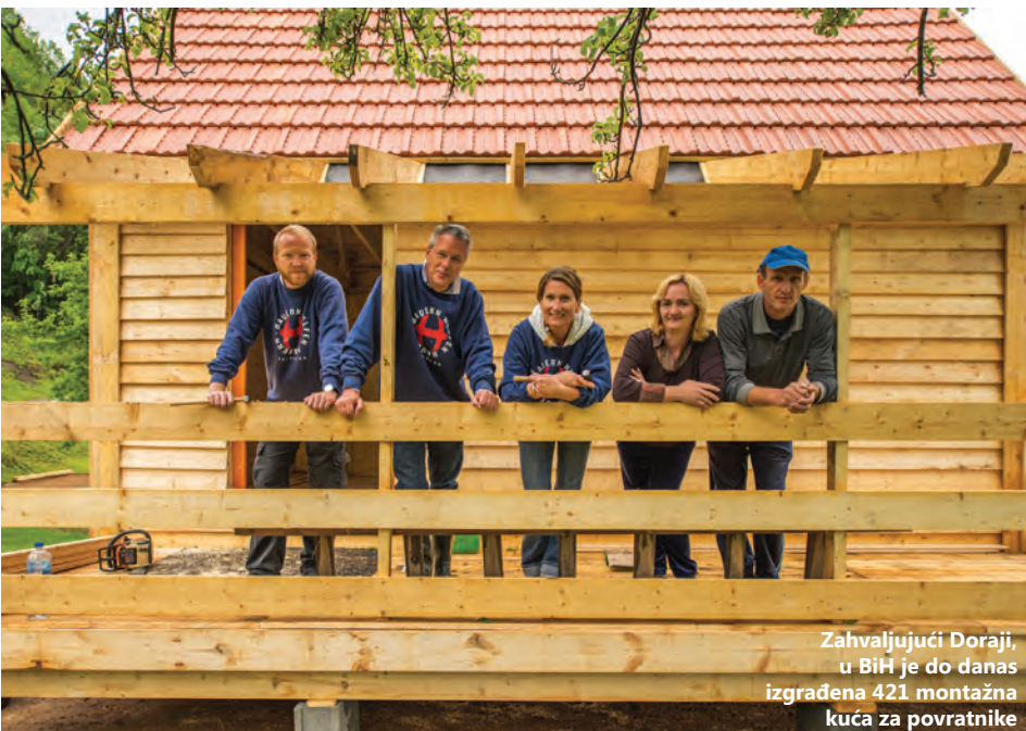
Zahvaljujući Doraji, u BiH je do danas izgrađena 421 montažna kuća za povratnike