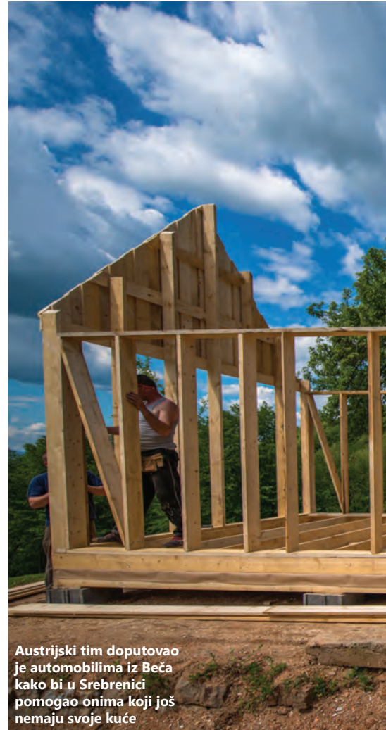
Austrijski tim doputovao je automobilima iz Beča kako bi u Srebrenici pomogao onima koji još nemaju svoje kuće

onim što je vidjela. Pitala je ljude kako im može pomoći, a oni su odgovarali da ne žele postati izbjeglice, da žele imati svoje domove. Nije znala šta da radi, pa se vratila u Salzburg. Bio je novembar 1992., i na televiziji je gledala emisiju u kojoj je stotinu ljudi za stotinu sati izgradilo stotinu kuća u Kölnu. Emisija je imala veliku popularnost i u njoj su učesnici radili svakakve podvige pomjerajući granice ljudske snage. "Bingo! Upravo to mi je trebalo!" Došla je do kontakta jednog od graditelja iz emisije i pitala ga samo jedno: "Možete li me naučiti da gradim kuće kao vi?" Čovjek je nije ništa pitao – samo je rekao da može. Prvi korak ka Dorajinoj ideji je bio napravljen. Sjela je i napisala stotinu pisama svojim imućnijim prijateljima, neki su raspolagali drvetom, neki građevinskim materijalom, neki novcem, i projekat se polako kristalizirao. Prvi se javio jedan farmer. Na Božić je izgrađena prva montažna kuća u Hrvatskoj i dosad ih je putem organizacije "Farmeri pomažu farmerima" u toj zemlji napravljeno 1063.